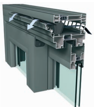
CP130 com Ventalis