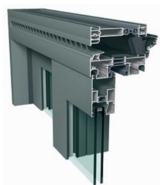
CP130 LS com Ventalis