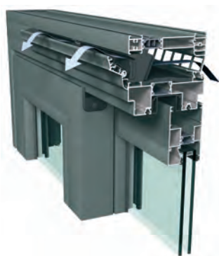
CP130 com Ventalis