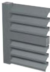
LÂMINAS EM FORMA DE Z