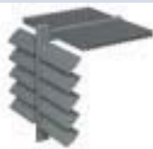
BS 100 LÂMINAS FIXAS