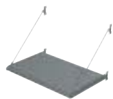
BS100 ESTRUTURA PRÉ-MONTADA