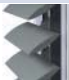
BS 100 LÂMINA AGARRADA