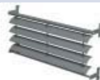
BS 20 ESTRUTURA PRÉ-MONTADA